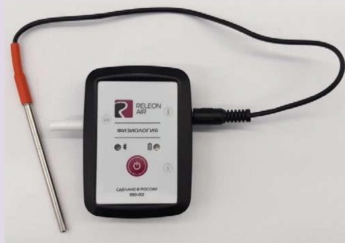
Рис. 12. Датчик температуры тела

Датчик температуры тела — предназначен для непрерывного измерения температуры тела в подмышечной впадине. Оснащён выносным зондом. Диапазон измерения: от 25 до 50 °С. Разрешение датчика: 0,1 °С. Технологическая особенность: для точного измерения в подмышечной впадине должна находиться вся металлическая часть зонда.