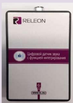
Рис. 7. Датчик звука

Датчик температуры термометрический предназначен для измерения температур до 900. Используется при выполнении работ, связанных с измерением температур плавления и разложения веществ, а также для измерения температуры в экзотермических процессах. Датчик звука — измеряет уровень шумов в окружающей среде и при оценке шумопоглощающих изоляторов. Динамический диапазон: от 30 до 130 дБ. Частотный диапазон: от 50 Гц до 8 кГц. Разрешение: 0,1 дБА (акустические децибелы). Техно-логические особенности: датчик чувствителен к резким звукам, которые могут дать завышенные результаты измерений.