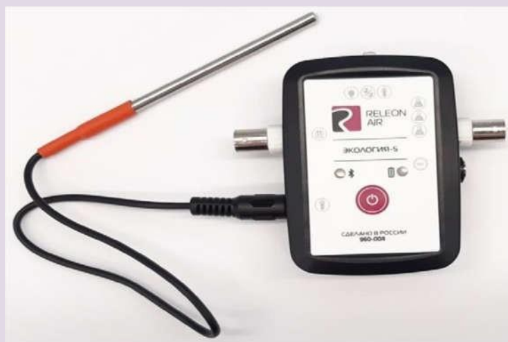
Рис. 6. Датчик температуры растворов

Датчик температуры термометрический предназначен для измерения температур до 900. Используется при выполнении работ, связанных с измерением температур плавления и разложения веществ, а также для измерения температуры в экзотермических процессах. Датчик звука — измеряет уровень шумов в окружающей среде и при оценке шумопоглощающих изоляторов. Динамический диапазон: от 30 до 130 дБ. Частотный диапазон: от 50 Гц до 8 кГц. Разрешение: 0,1 дБА (акустические децибелы). Техно-логические особенности: датчик чувствителен к резким звукам, которые могут дать завышенные результаты измерений.