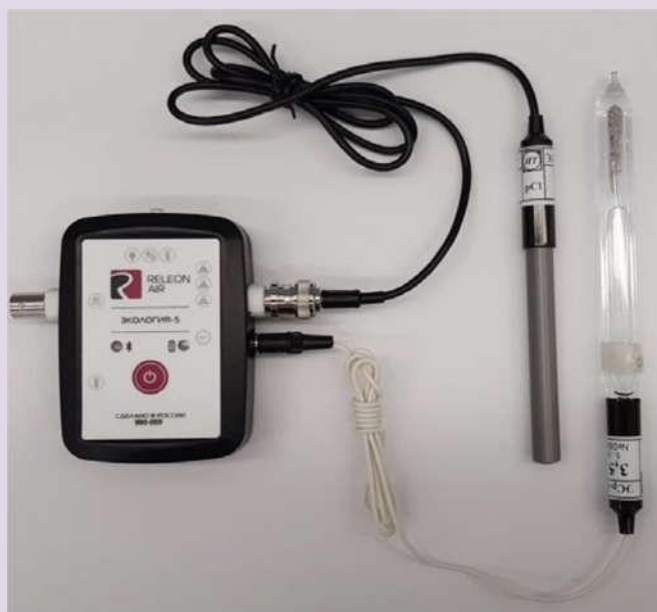
Рис. 10. Ионоселективный датчик (присоединены электро хлорид-ионов и электрод сравнения)

Датчик кислорода — предназначен для определения относительной концентрации кислорода в воздухе. Диапазон измерения: от 0 до 100 %. Разрешение: 0,1 %. Технологические особенности: при измерении содержания газа в выдыхаемом воздухе необходимо держать мембрану максимально близко ко рту; восстановление показаний на воздухе происходит через 1—2 минуты (время диффузии через мембрану).