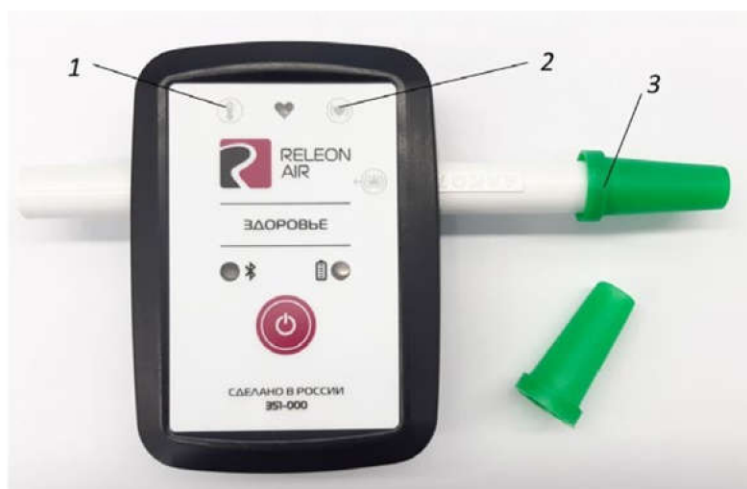
Рис. 3. Мультидатчик по физиологии. Обозначение разъемов и технологических отверстий: 1 — температура тела, 2 — пульс, 3 — частота дыхания (надет съёмный мундштук)

Мультидатчик по физиологии позволяет определять артериальное давление, пульс, температуру тела, частоту дыхания, ускорение движения (рис 3).