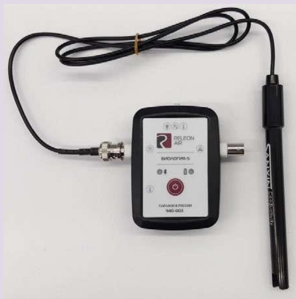
Рис. 5. Датчики электропроводимости

Датчик электропроводимости — предназначен для регистрации и измерения удельной электропроводности жидких сред, в том числе и водных растворов веществ. Применяется при изучении характеристик водных растворов, в том числе почвенных вытяжек.