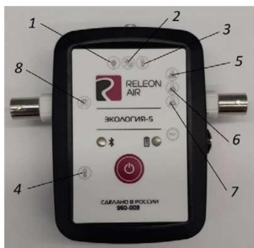
Рис. 2. Мультидатчик по экологии. Обозначение разъёмов и технологических отверстий: 1 — освещённость, 2 — относительная влажность воздуха, 3 — температура окружающей среды, 4 — температура растворов, 5 — нитрат-ионы, 6 — хлорид-ионы, 7 — pH, 8 — электропроводность

Мультидатчик по экологии позволяет измерять следующие показатели: водородный показатель водных сред, концентрации нитрат-ионов и хлорид-ионов, электропроводность, влажность, освещённость, температуру окружающей среды, температуру растворов, растворов и твёрдых тел (рис. 2).