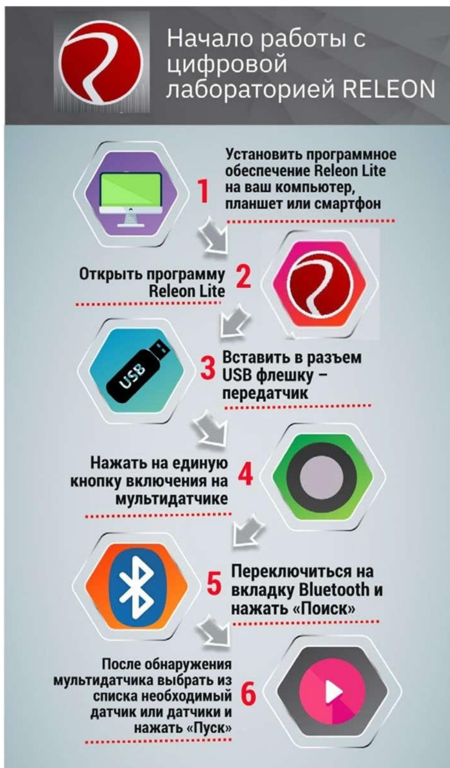
Рис. 14. Алгоритм работы с программным обеспечением Releon Lite

При изучении естественных наук в современной школе огромное значение имеет наглядность учебного материала. Наглядность даёт возможность быстрее и глубже усваивать изучаемую тему, помогает разобраться в трудных для восприятия вопросах, и повышает интерес к предмету.