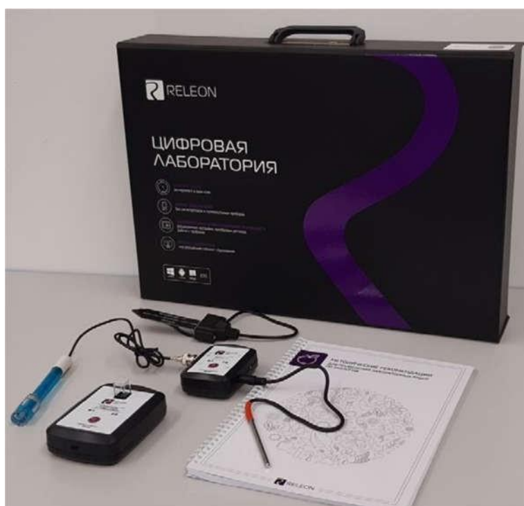
Рис. 1. Цифровая лаборатория

Ниже дана краткая характеристика цифровых датчиков, приведены выявленные на практике технологические особенности применения. Учёт этих особенностей позволит правильно использовать датчики и продлить срок их службы.