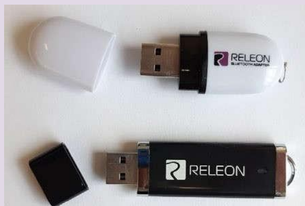
Рис. 13. Общий вид USB-флеш-накопителя (внизу) и Bluetooth-адаптера (вверху) Releon

В комплекте цифровой лаборатории Releon поставляется программное обеспечение Releon Lite на USB-флеш-накопителе, а также Bluetooth-адаптер для связирегистратора данных с беспроводными датчиками (рис. 13).