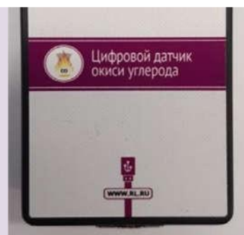
Рис. 11. Датчики кислорода (слева) и угарного газа (справа)