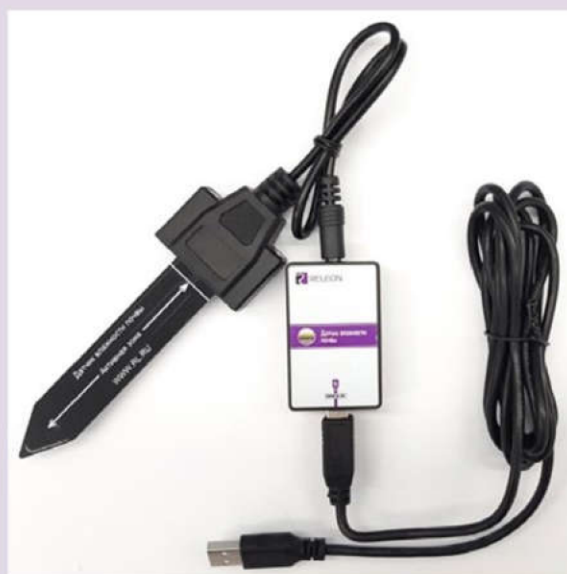
Рис. 4. Датчик влажности почвы

Датчик влажности почвы — предназначен для измерения степени увлажнения почвы, выраженной в процентах. Применяется в агроэкологических и сельскохозяйственных исследованиях.