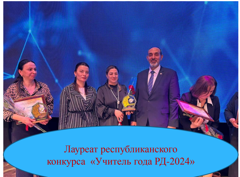
Лауреат республиканского конкурса «Учитель года РД-2024»